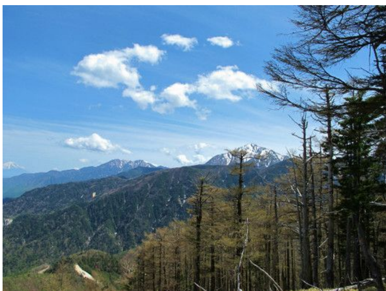
甲斐駒ヶ岳と鳳凰三山