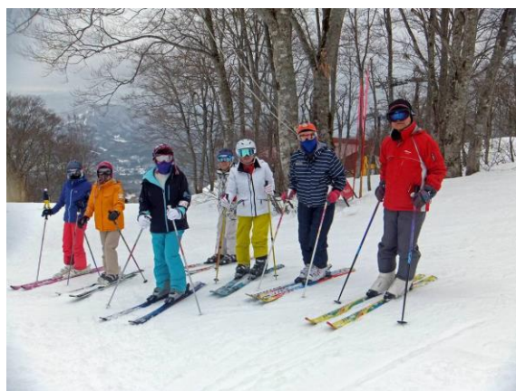
参加メンバー一部の面々。