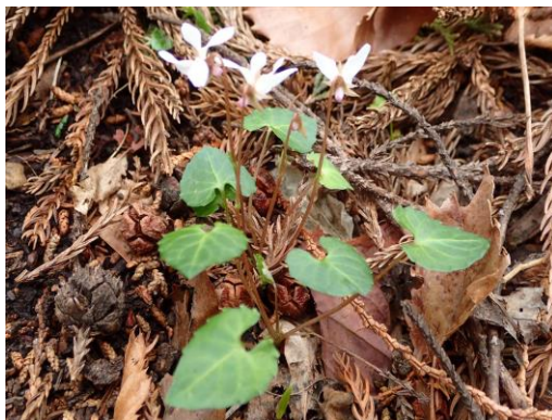
ヒメミヤマスマレ