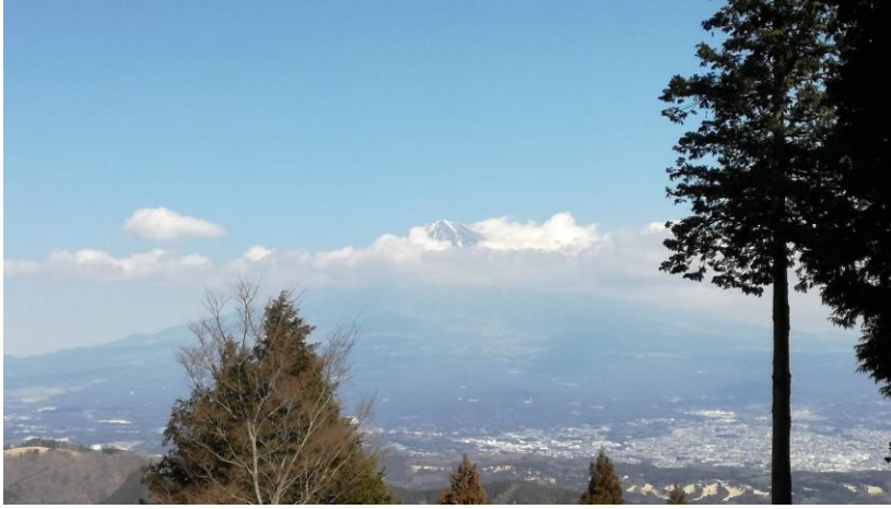
白鳥山頂より富士山