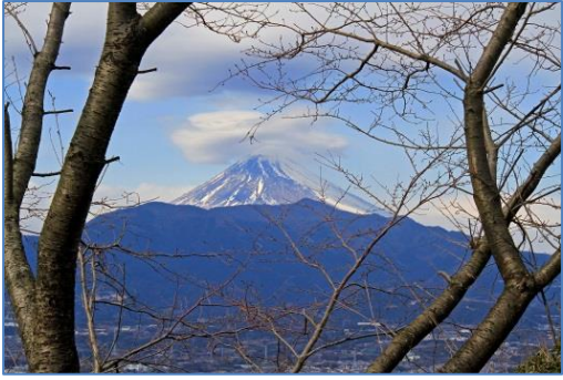
頂上から展望台の途中で愛鷹山と富士山