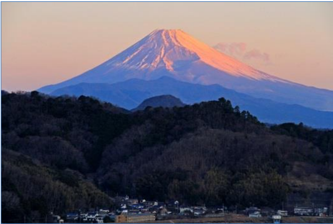
大仁から朝日に輝く霊峰富士