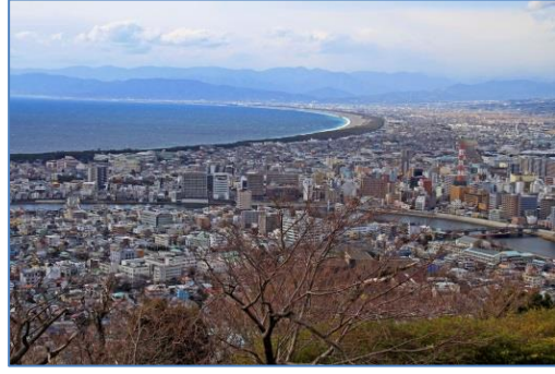
沼津市街と千本松原